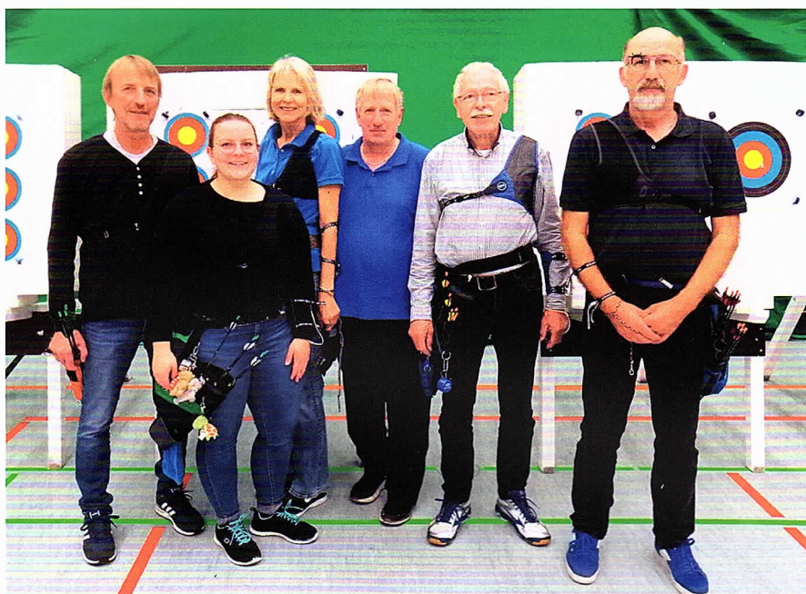
Ein perfekt eingespieltes Team.

SSV Tarmstedt richtet erneut die Landesmeisterschaft aus